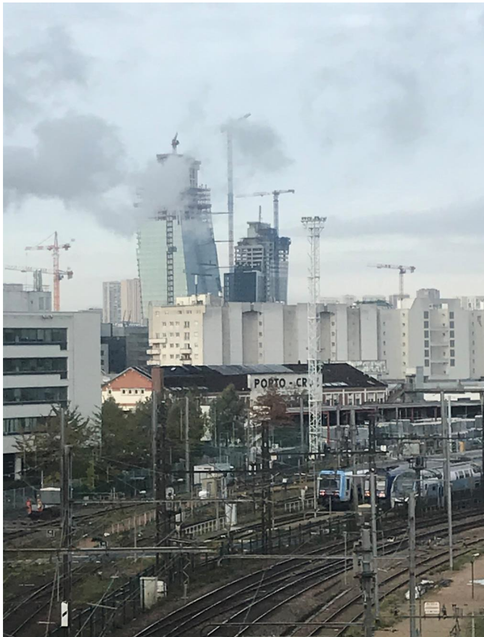
(Les tours « Duo » vues de Charenton)

Ou sur notre site internet : http://natixis.reference-syndicale.fr/